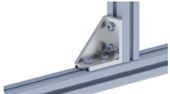
Aluwinkel 30/60 Alu Connection Angle 30/60